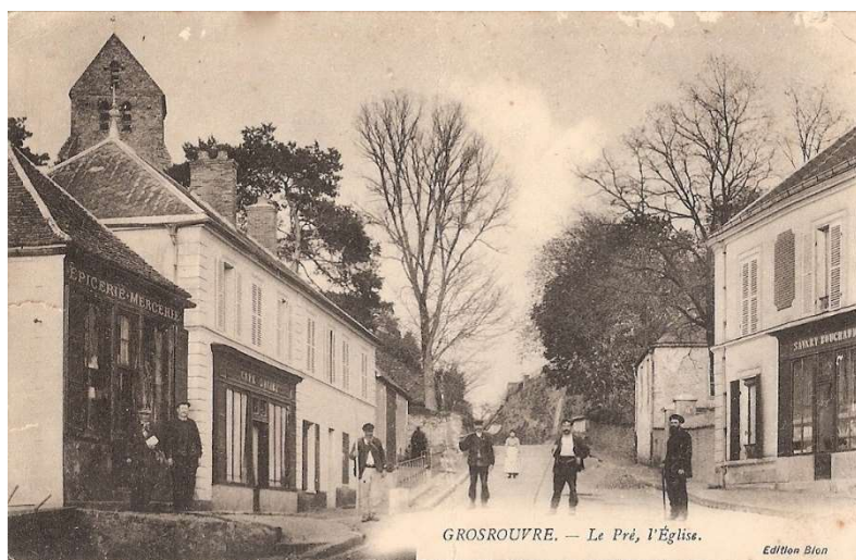
LA SOCIÉTÉ HISTORIQUE ET ARCHÉOLOGIQUE DE RAMBOUILLET ET DE L'YVELINE Grosrouvre, le bourg au début du XX e siècle